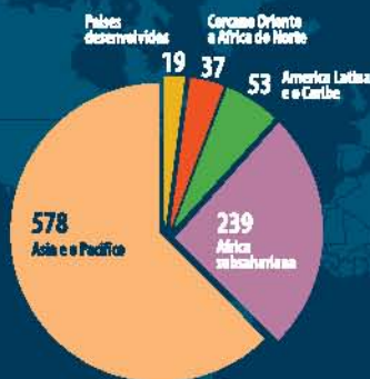
A GRÁFICA AMOSA ONDE HABITAN AS PERSOAS (EN MILLÓNS) QUE SOFREN A FAME (2010) 1