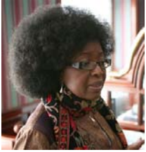
Efua Dorkeeno, OBE.

Efua Dorkenoo es una activista ghanesa reconocida como una de las principales referencias mundiales en la lucha contra la Mutilación Genital Femenina. Actualmente reside en Londres y dirige en Reino Unido el programa internacional de lucha contra la MGF de la organización EQUALITY NOW .